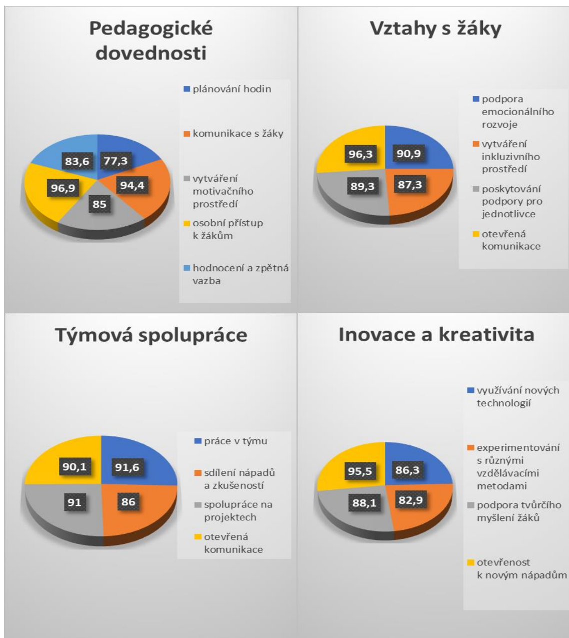
Výstupy z evaluace silných stránek pedagogů č.1

Jako slabší vnímají pedagogové oblast plánování hodin. Z pohledu vedení školy vnímám toto zjištění jako příležitost pro podporu kolektivu, např. tandemová výuka, nastavení učící se skupiny apod.